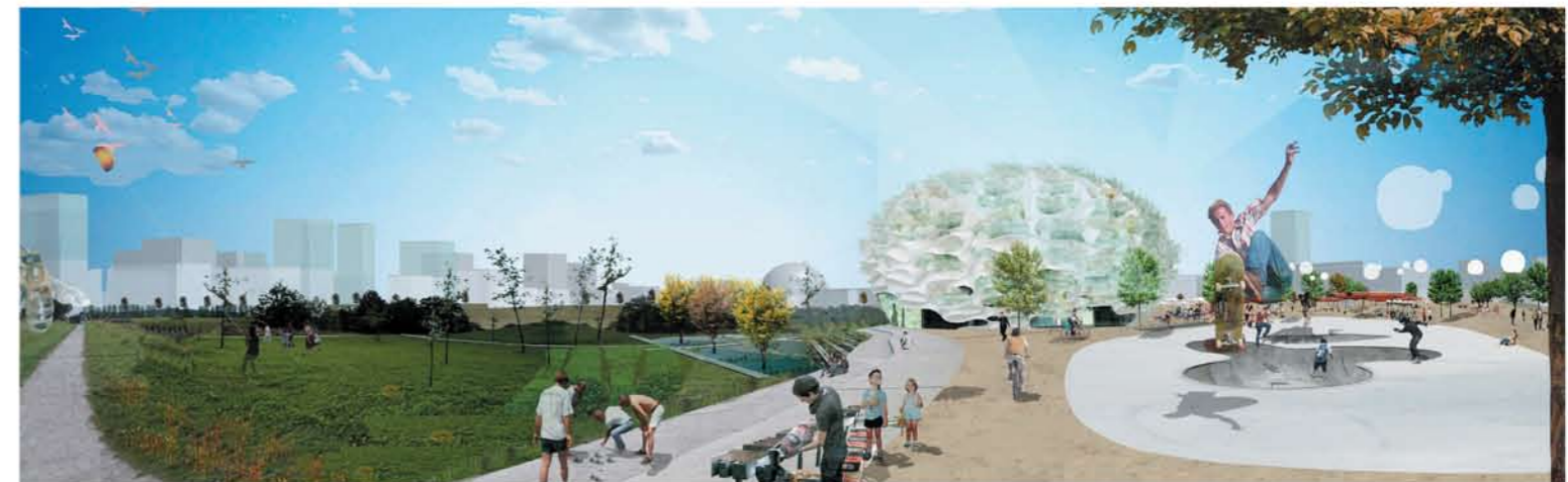
Årstaparkens "strandlinje" - kanten mellan natur- och kulturlandskap. Eko-globen i förgrunden med Globen bakom.