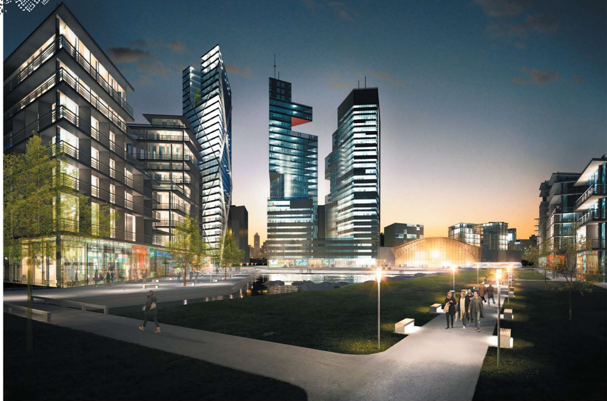
Cité SUD. Perspektiv vid övergång Park och Stad