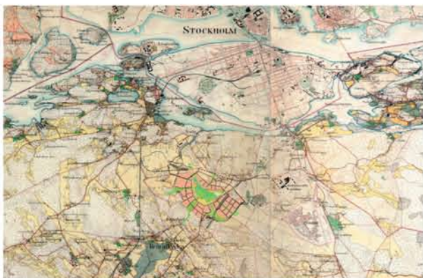
Häradsökonomiska kartan från 1900-talets första år med den nu tilltänkta bebyggelsen och parken inlagd.