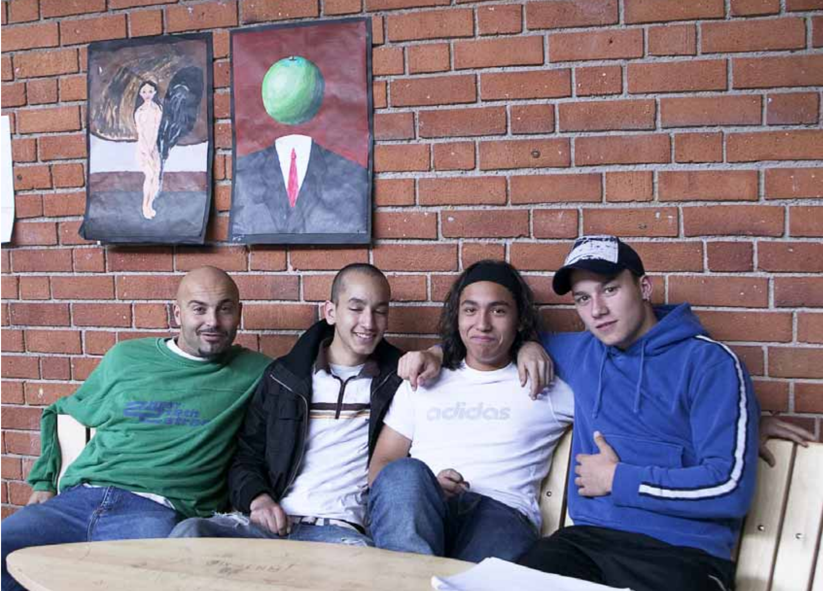
Om eleverna tycker att det är roligt att gå i skolan, är det den bästa skyddsfaktorn mot att utveckla missbruk och andra problem.

NU JOBBAR SKOLAN SAKTA men säkert vidare med de fyra hörnstenarna. Dels har de tillsammans med Nätverkhuset tagit fram en drogpolicy, dels har de jobbat med att få bättre fungerande hälsosamtal hos skolsystemer. Varje månad får arbetslagen handledning med deras eget förhållningssätt till sitt arbete.