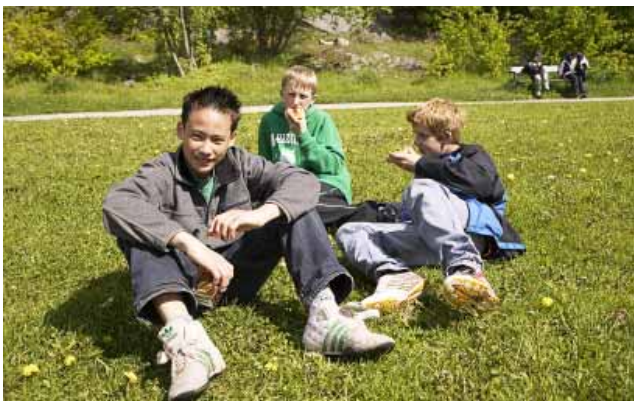
De flesta elever trivs bättre på skolan efter projektet.