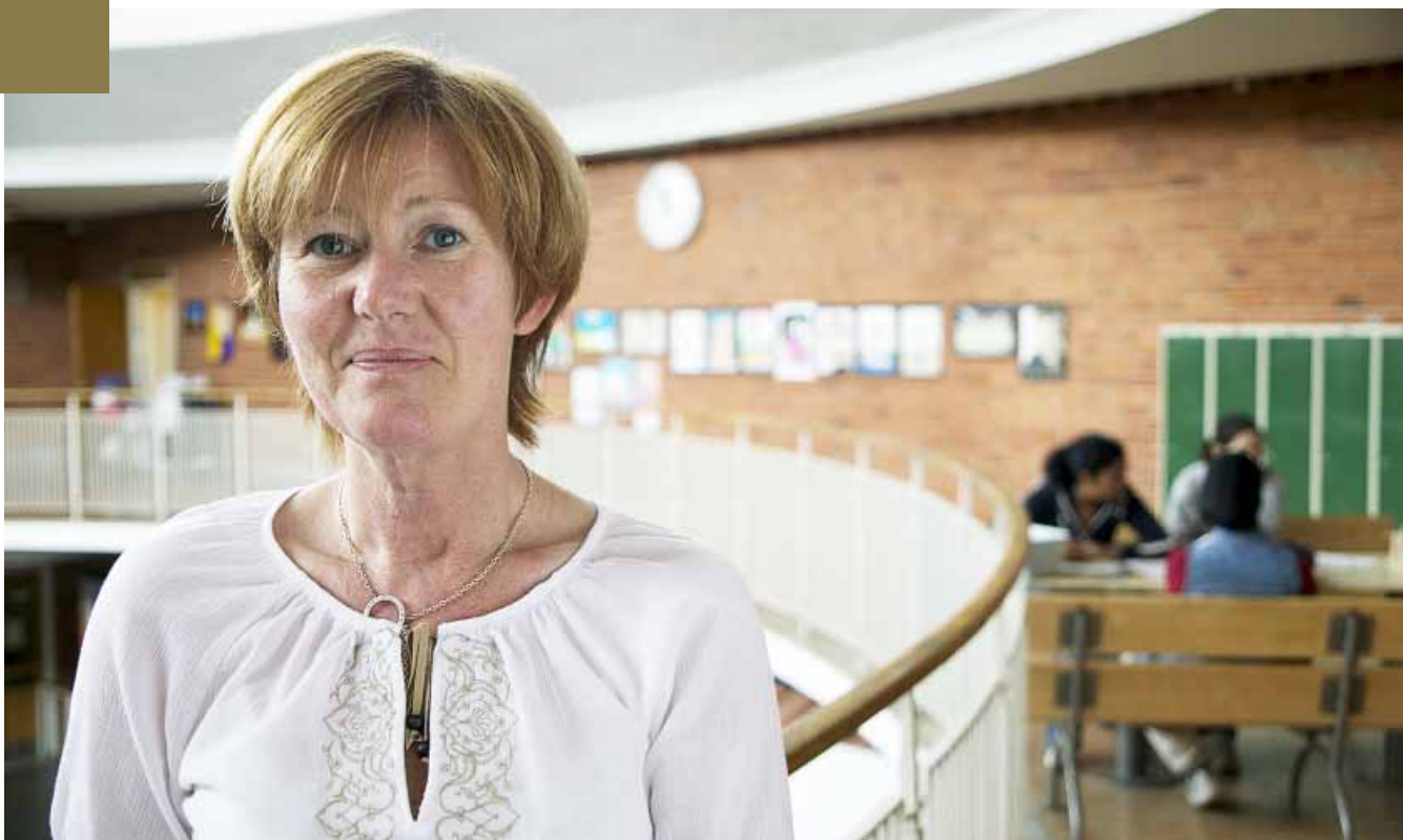
Arbetslaget arbetar på att få en samstämmig syn på hur skolan bemöter elever och föräldrar.