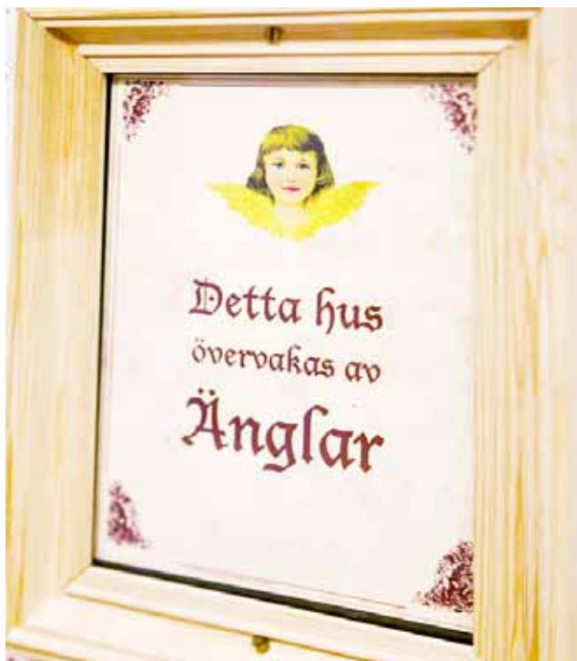
Stämningsfull interiör från Hjulstaskolan.

tolkar på mötena men när det är många olika språk som det ska tolkas till samtidigt är det svårt att ha diskussioner. Det är svårt att skapa ett trivsamt sorl.