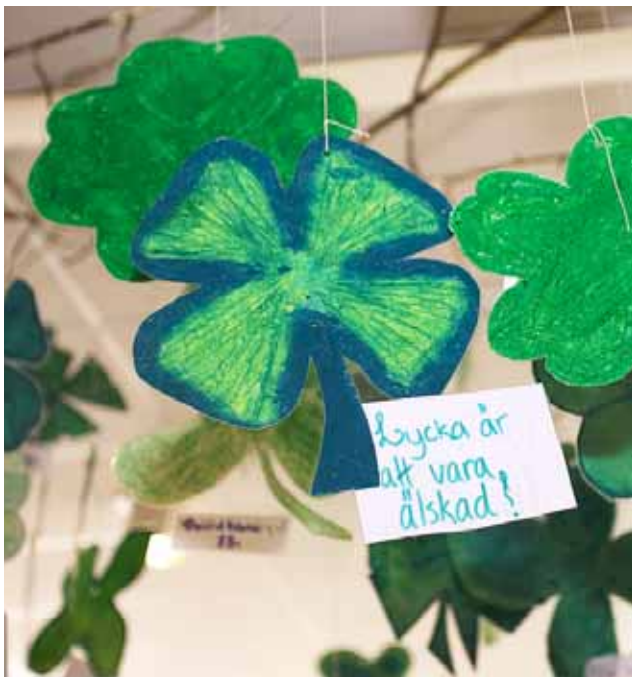
Eleverna uttryckte sina tankar kring lycka. Resultatet blev en "lyckomobil".

med mera. På det sättet skulle det kunna vara en mötesplats i närsamhället.