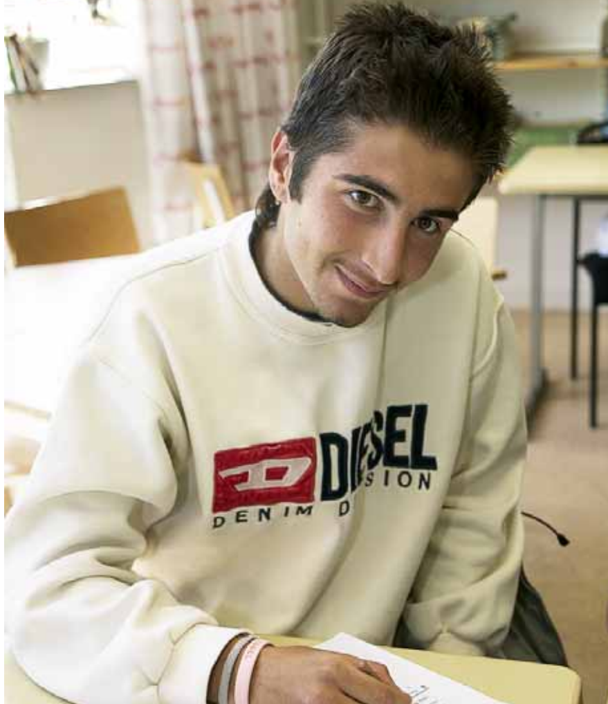
Elev på Enbackens skola som deltar i Trestadsprojektet. Personen på bilden har inget med artikeln att göra.

farföräldrar. Därför blir det mer kännbart för dem att bli konfronterad med någon i sin egen familj än att bli förflyttad, säger Jack.