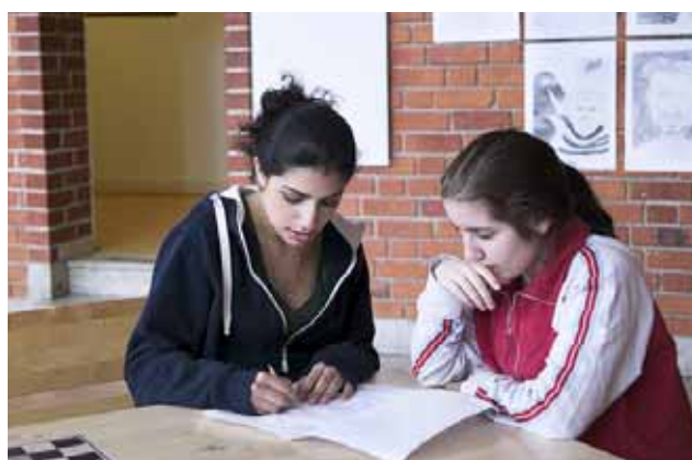
En skola med hög trivsel har även ett gott studieklimat.