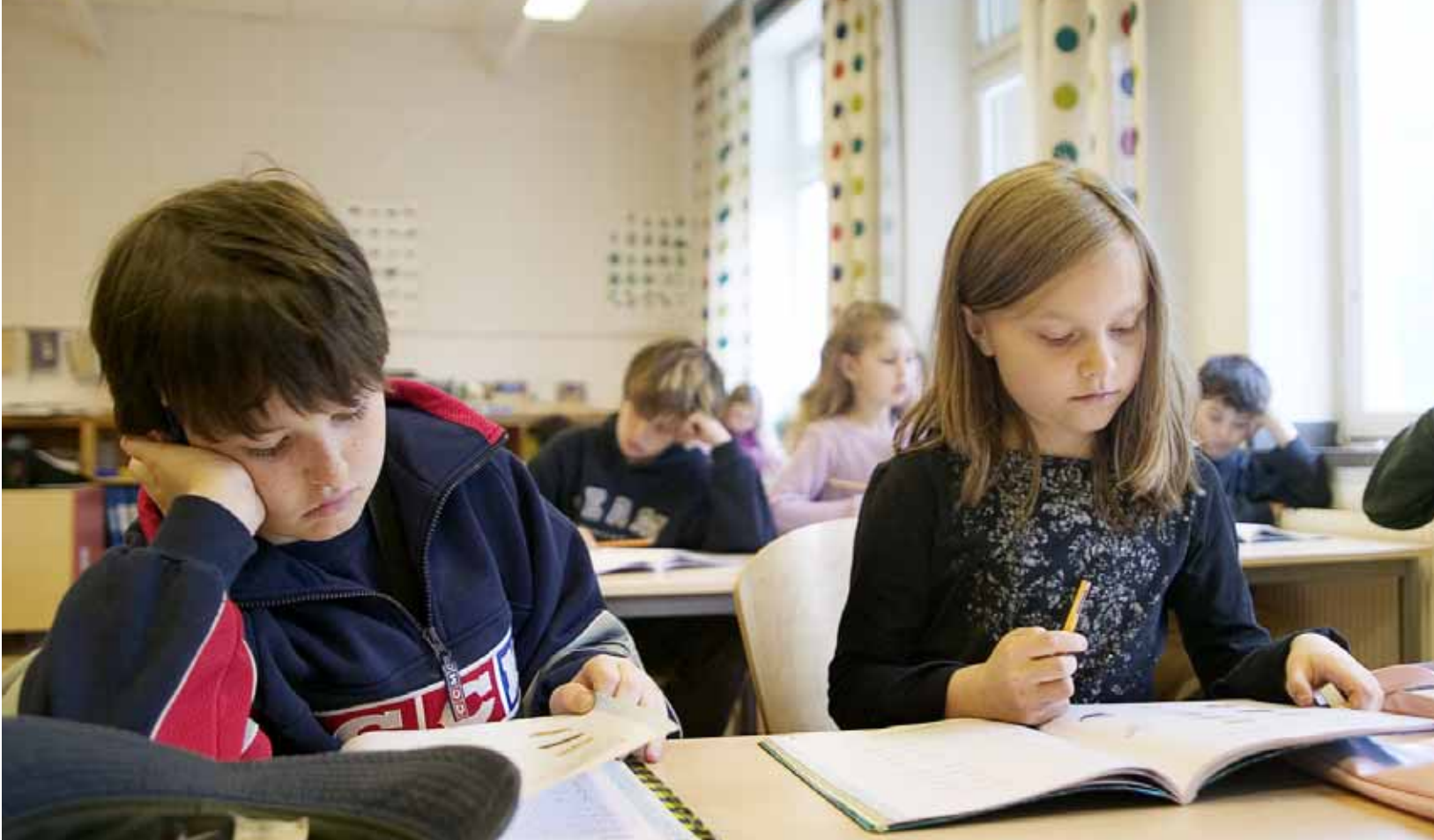
Trivsel, lugn och ro i skolan ger eleverna studiero och tillgodogöra sig lektionstiden bättre.

” Vi som kommer in i skolan tror att vi gör ett jättebra jobb och rektorerna tror att de löst problemet.”