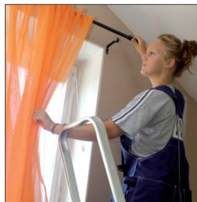
Byta/hänga upp gardiner