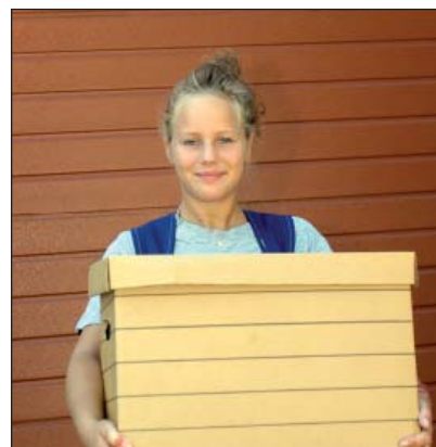
Bära tunga saker