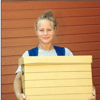
Transportar objetos pesados