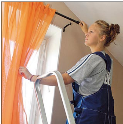
Cambiar o colgar cortinas