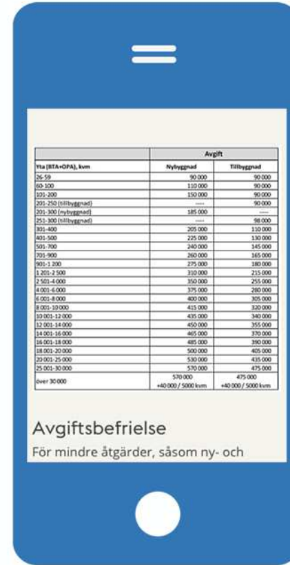
Tabelldata i en bild som blir omöjlig att läsa på liten skärm.