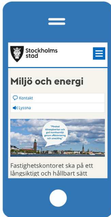
Text i en bild som därför inte går att läsa på en liten skärm.