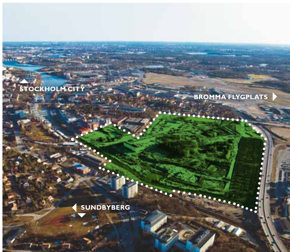
Annedal ligger i den nordvästra delen av Mariehäll, nära Sundbybergs centrum.

I Sundbybergs centrum, ca 10-15 minuters promenad från Annedal, finns både regionaltåg, pendeltåg, T-bana och bussar. Buss trafikerar Bällstavägen med en hållplats mittemot Mariehälls kyrka. Till Bromma flygplats, som har täta avgångar till bland annat Malmö, Göteborg, Umeå och Bryssel, tar det fem minuter med buss eller bil. Annedal kommer enligt planerna att trafikeras av buss inom området, samt tvärbanan inom gångavstånd. Utbyggnaden av tvärbanans gren mot Solna planeras att tas i drift under 2013 och den närmaste hållplatsen kommer att vara belägen vid Bällsta bro. En gren mot Kista är också planerad med en hållplats vid Ulvsundavägen intill Annedal.