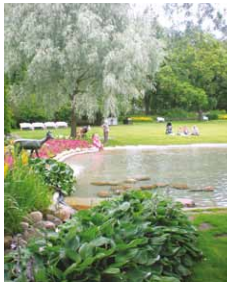
Marabouparken, utsedd till Sveriges vackraste park 2008.

Mariehäll är idag en mycket parkfattig stadsdel. I Annedal har man därför lagt stor vikt vid att ge utrymme för parker och grönområden. Tre nya parker kommer att anläggas och nuvarande naturområden, exempelvis en ekkulle, kommer att bevaras. Bällstaån har vidgats för att erbjuda en trevlig, öppen vattenyta. Längs med ån anläggs ett helt nytt promenadstråk. Det finns planer på att förlänga strandpromenaden längs med Bällstaviken in mot de centrala delarna av Stockholm. Några minuters gångväg bort finns Marabouparken som, förutom avkoppling i gröngräset och bad för de minsta, även erbjuder intressanta konstutställningar i den nya konsthall som byggs under parken.