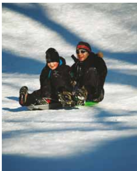
Annedal utformas för både stora och små.

Annedal planeras med särskild omsorg om barns utomhusmiljö. Förutom de anlagda parkerna finns ett flertal naturområden som inbjuder till spontan lek. Mitt i området ligger Annedalsparken som ger möjlighet till många aktiviteter. Här finns bland annat ekbacken som erbjuder pulkaåkning, samt bollplan, lekplatser och promenadstråk. Ett motionsområde för äldre personer med olika arbetsredskap för att träna balans och styrka planeras, liksom ett aktivitetstorg där ungdomar kan roa sig med exempelvis streetbasket.