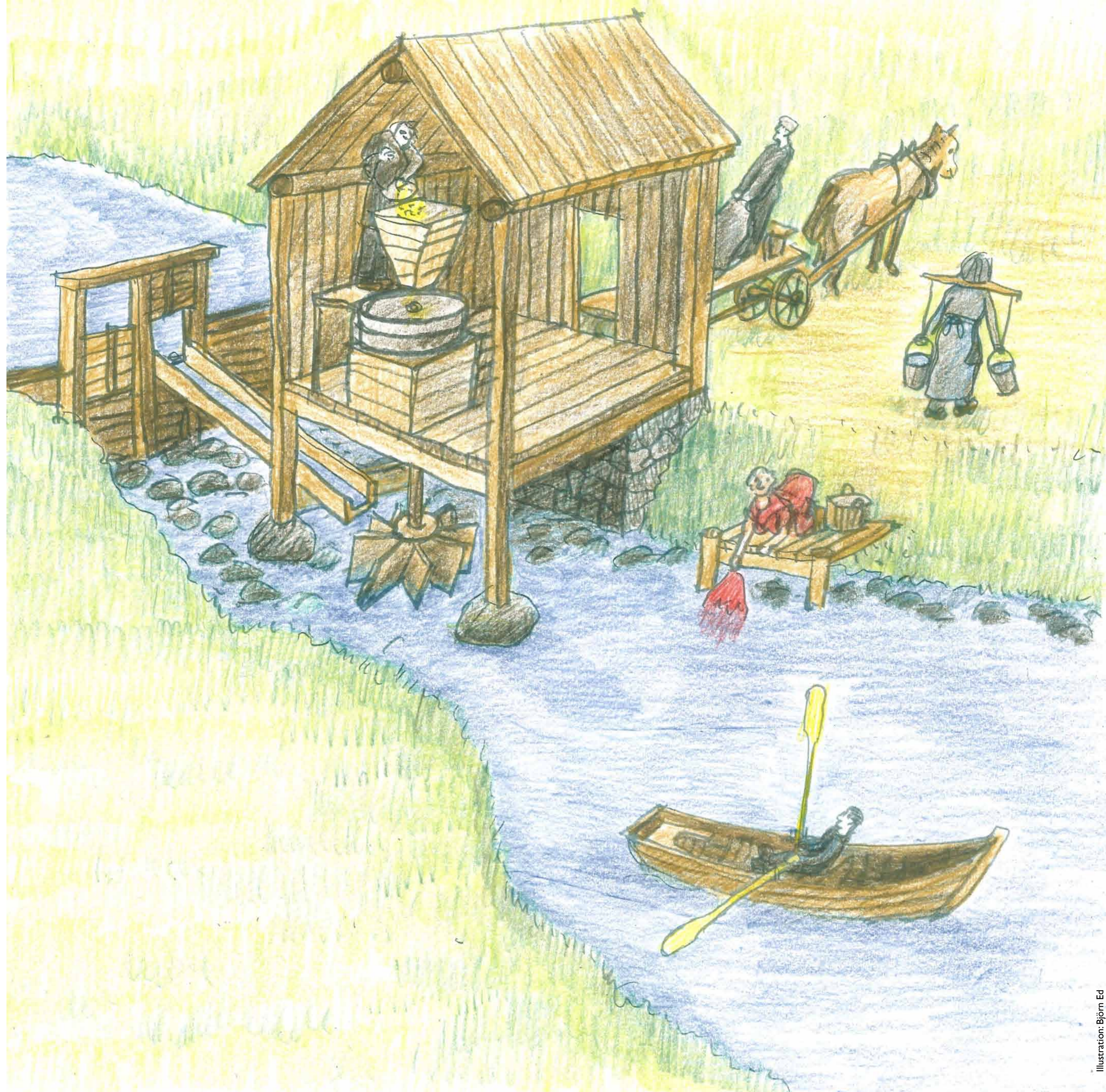
Illustration: Björn Ed

Fisket i Igelbäcken var ett omtyckt tillskott till kosthålllet. Det sägs att kung Fredrik I planterade in fisken grönling i bäcken på 1700-talet. Den ansågs som en läckerhet. Nu är den en raritet som ska skyddas.