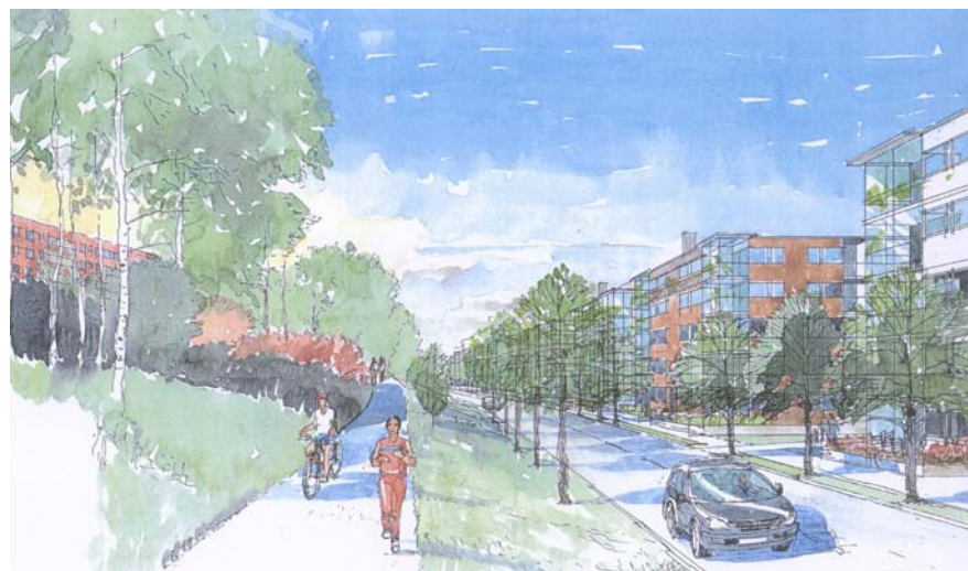
Finlandsgatan västerut med föreslagen ny flerbostadsbebyggelse till höger

En ny strukturplan för västra delen av norra Järvafältet föreslås upprättas. I den och vid en eventuell detaljplaneläggning för det aktuella området bör det närmare klargöras om Norgegatan ska förlängas i riktning mot Akallas arbetsområde. En sådan dragning skulle inte hindra en bebyggelse i det aktuella området.