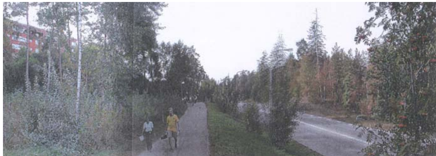
Finlandsgatan idag västerut

Området ligger norr om Husbys nuvarande bostadsbebyggelse och söder om Akallas arbetsplatsområde. I väster gränsar området till kontorsbebyggelse i kv Ekenäs. Avståndet till Husby respektive Akallas (östra) centrum med tunnelbana är 600-800 meter. Området är ringa besökt och naturvärdena bedöms som låga. Enklaven som är