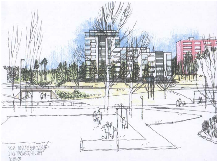
Nytt flerfamiljshus i kv Tromsö i Husby