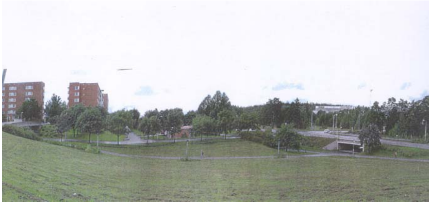
Vy mot väster mot korsningen Sveaborgsgatan – Finlandsgatan