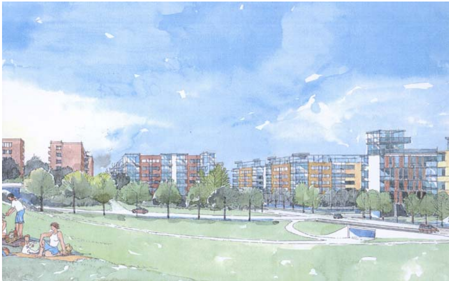
Bebyggelseförslag med ny bebyggelse i korsningen Sveaborgsgatan - Finlandsgatan