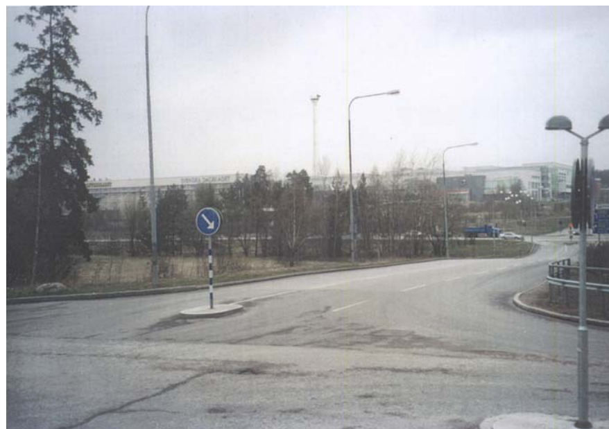
Sveaborgsgatans förlängning mot Akalla arbetsområde

Sammantaget föreslås i föreliggande framtidsbild att närmare 1 000 normalstora lägenheter byggs på ömse sidor av Finlandsgatan i Akalla och Husby (fram till Husbykorset). Därtill kommer arbetsplatsytor om närmare 57 000 BTA söder om Hanstavägen i de båda stadsdelarna.