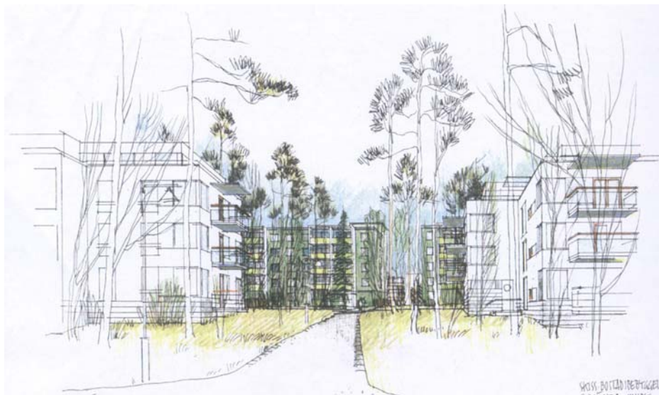
Stadsvillor i Husby söder om kvarteret Trondheim

En sammanvägning av förslagets förutsättningar och konsekvenser leder fram till att kontoren inte kan rekommendera stadsvillor söder om Husby.