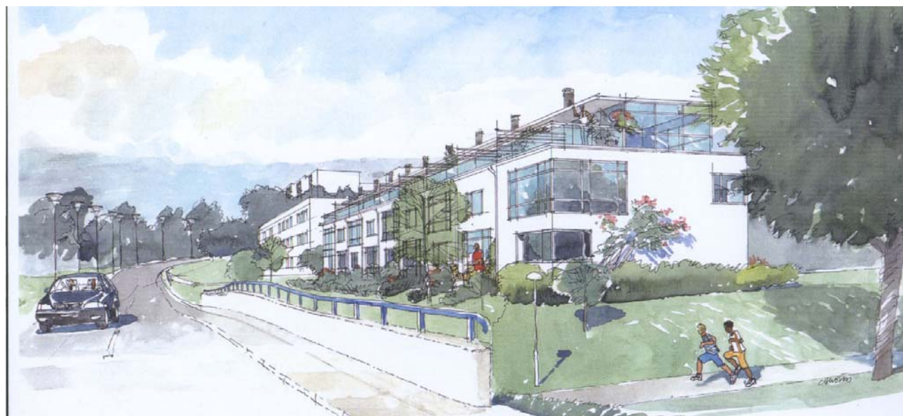
Förslag till ny bebyggelse