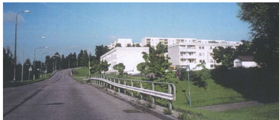
Storbyplan från Rinkebysvängen, idag