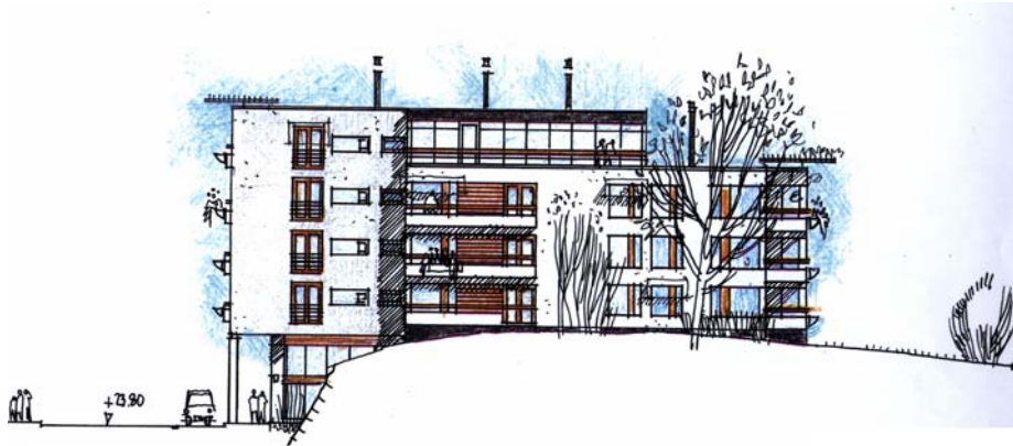
Fasad sedd från Hagstråket

Det centrala läget i Tensta gör den aktuella tomten attraktiv för bebyggelse. Läget blir inte mindre attraktivt genom att tomten gränsar till ett mindre grönområde som avses rustas upp. Kontoren föreslås att tre flerfamiljshus med ca 50 lägenheter byggs på platån vid Tenstaplan. Närheten till centrum motiverar dels flerbostadshus dels att andelen mindre lägenheter blir tämligen hög. Husen föreslås stå med gavlarna mot Tenstaplan och kraga ut över klippan och landa på Tenstaplan. Möjligheten att i "källarvåningen" inrymma butikslokaler får studeras under planarbetets gång. Klippan och grönskan kommer att synas från Tenstaplan och Tenstaplan mellan husen. Genom att de föreslagna byggnaderna tillkommer skulle en upprustning ske av kvarvarande naturmark.