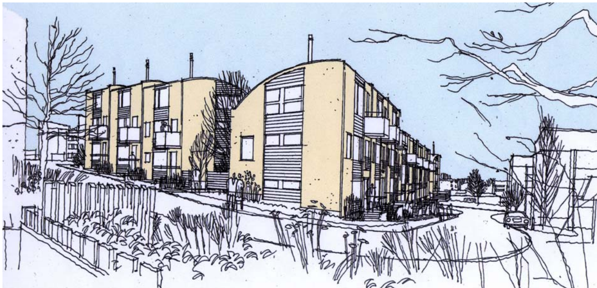
Fasader mot Edingekroken

På det övre parkeringsdäcket föreslås 16 radhus. Det undre planet föreslås även fortsättningsvis nyttjas för parkering. Radhusen kragar ut över däckets kant och står delvis på marken. Därmed döljs stora delar av den grå betonganläggningen. Byggnadsstättet prövas nu i kv Handkvarnen i Rinkeby. Det höga och soliga läget ökar radhusens attraktivitet. Om det visar sig nödvändigt att behålla den befintliga stortvättstugan och elnätstationen utgår 4-5 radhus. Kvarvarande parkeringsplatser räcker för att tillgodose parkeringsnormen vid nybyggnad i ytterstaden.