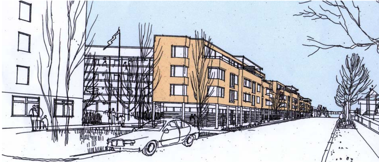
Fasad mot Hjulsta Backar

Tre stadsvillor/korta flerfamiljshus med ca 30 lägenheter föreslås på den befintliga parkeringsplatsen norr om Hjulsta Backar. Avståndet mellan de befintliga husen på ömse sidor om Hjulsta Backar är idag närmare 50 meter (en normal innerstadsgata är 18 meter). Gatans attraktion skulle öka om tre stadsvillorna i tre till fyra våningar skulle förläggas på den befintliga parkeringsplatsen. Radhus har prövats men bredden (ca 17 meter) på parkeringsytan gör att radhus bedömts som mindre lämpliga på denna plats.